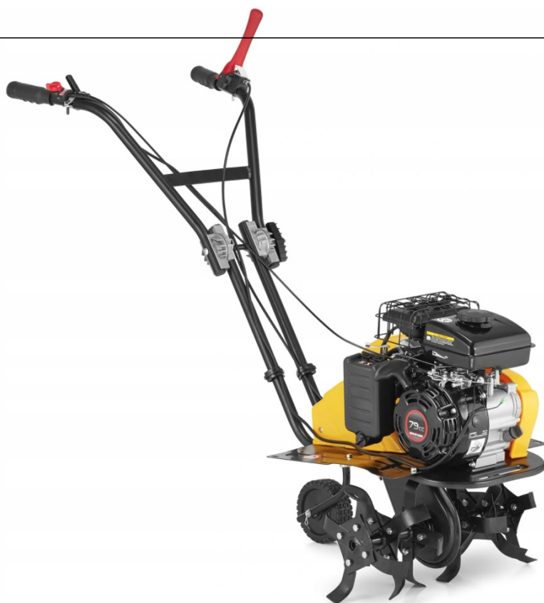
SCHEMA DEL MOTOCOLTIVATORE